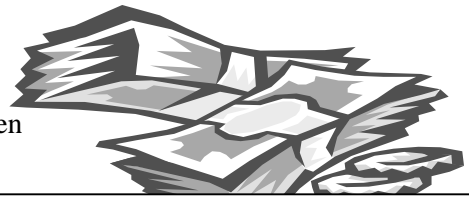
Entwicklung der Gemeindefinanzen 2004

Positiv zu vermerken ist, dass wiederum sowohl der ordentliche als auch der außerordentliche Haushalt ausgeglichen werden konnte.