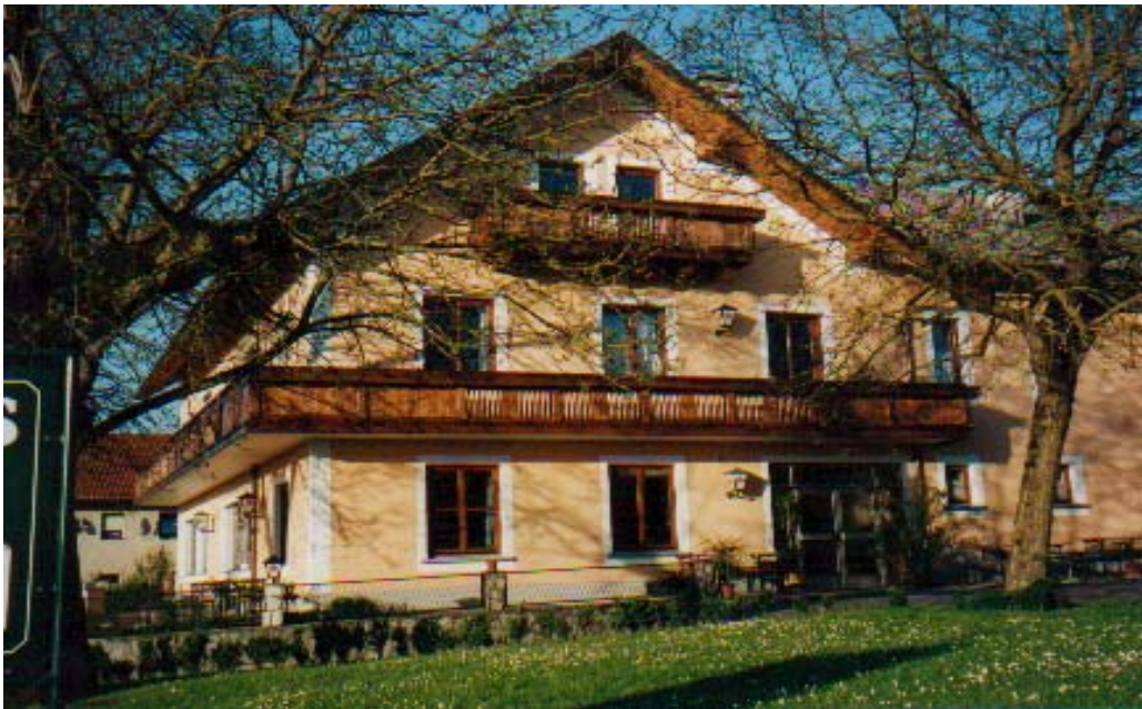
Das Gasthaus Mindl im Jahr 2004