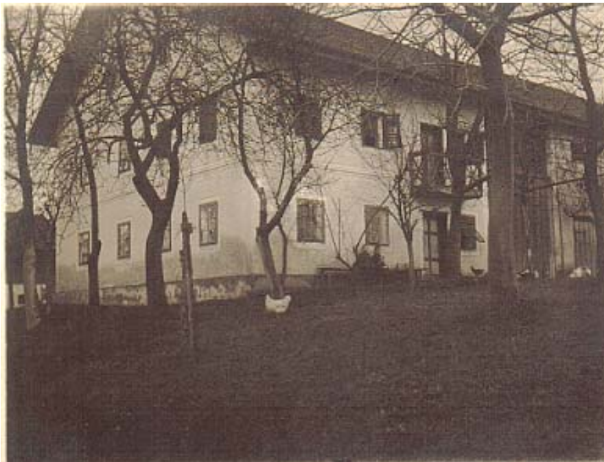
Fotografie aus dem Jahr 1917 (1. Weltkrieg)