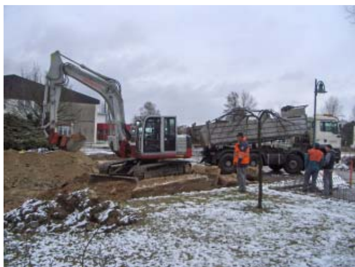
die ehemalige Parkfläche kann man momentan nicht erkennen...

Aufgrund der Dringlichkeit wurden die Neuerrichtung und die Sanierung des Parkplatzes nach Beschlussfassung des Straßenbauprogramms durch den Bauausschuss der Gemeinde Weng bereits begonnen.