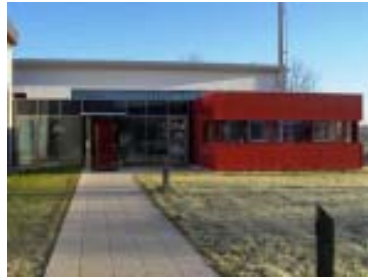
Der neue Gemeindegarten