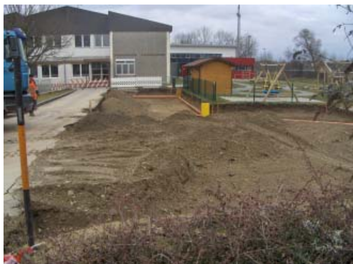
vom alten Spielplatz ist nichts mehr zu sehen