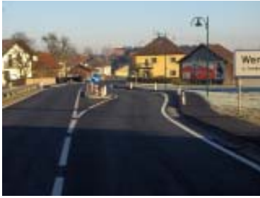
Ortseinfahrt Weng von Moosbach kommend