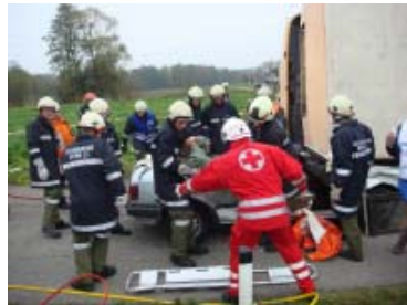
Bild einer FF-Übung

tätigkeiten, Kurse und Verwaltungsaufwand rund 5.400 Stunden unentgeltlich zum Wohle der Wenger Bevölkerung geleistet.