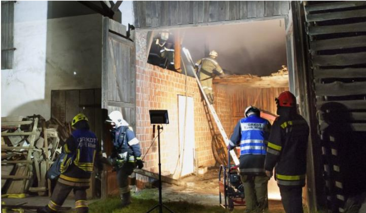
Abbildung 2: Erstes Brandobjekt