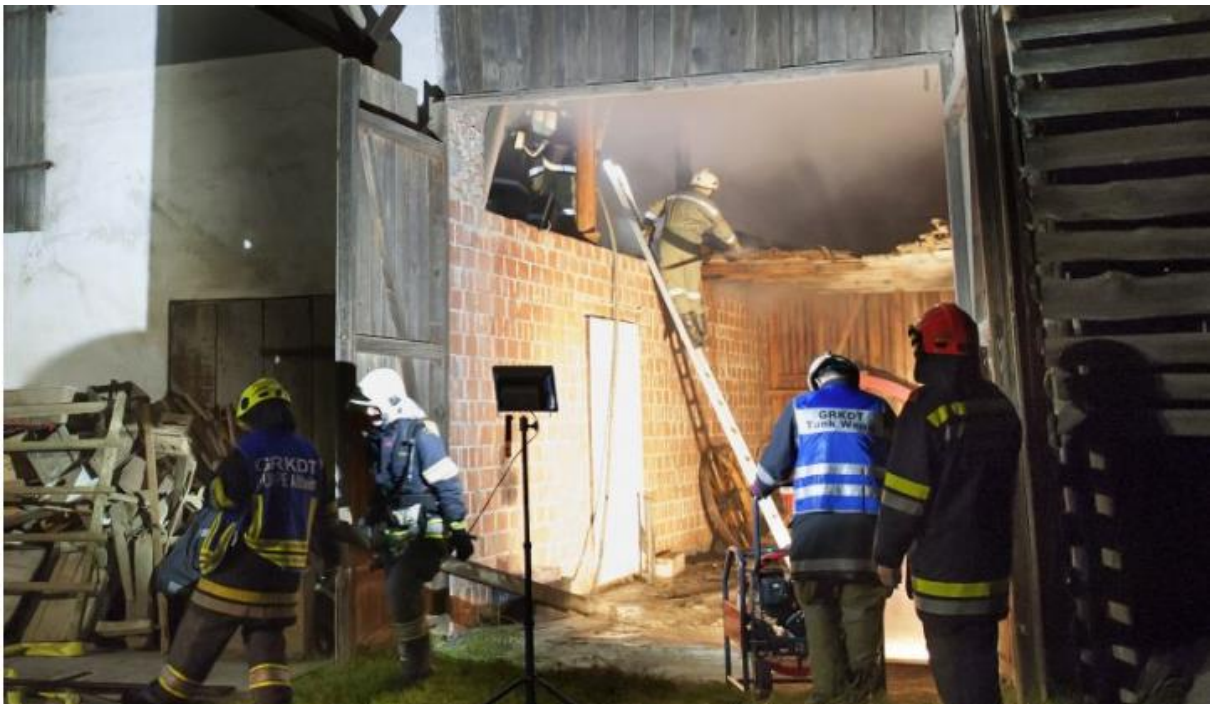
Brandeinsatz in der Gemeinde Moosbach