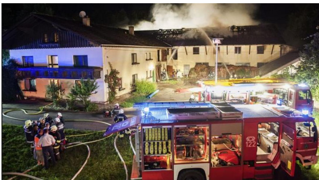
Abbildung 1: Drittes Brandobjekt

Der erste Brandeinsatz 2015 war zugleich auch der intensivste im Jahr 2015. Um kurz nach 02:00 wurden wir von der F.F. Moosbach zu Hilfe gerufen. Als wir dort beim ersten Brandobjekt mit unserem TLF-A und KDO eintrafen, wurde bereits unser LFB-A zusätzlich alarmiert, da sich schon ein zweites Gebäude in Brand befand. Das TLF-A verblieb an der ersten Einsatzstelle, während das LFB-A sich zu dem zweiten Brandobjekt begab. Rasch wurde die Einsatzleitung des ersten Objekts an die F.F. Weng übergeben, da sich in der Zwischenzeit in einem dritten Objekt ein Brand entwickelte. Der Brand des ersten Objektes konnte jedoch unter Mithilfe eines Atemschutztruppes schnell unter Kontrolle gebracht werden. Das LFB-A Weng wurde zwischenzeitlich an den dritten Brand beordert, dort wurde von uns eine Reserve Zubringerleitung aufgebaut um ein sicheres Vorgehen zu gewährleisten. Von der F.F. Weng waren insgesamt 16 Einsatzkräfte 39 Stunden im Einsatz.